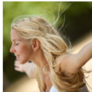
Entra al pozo de los Sentimientos