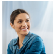
Descripta la Sinceridad