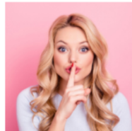
Respetar los Silencios

Profundizar en tus sentimiento hace que tu alma te transmita lo que más deseas. Puedes sentir tu verdadero ser hablando de todos los objetivos y lo que esperas de la vida y de este proyecto tan esperado. Sientes que la vida te trae algo y que es para ti, sin duda. Eres capaz de generar y materializar en tu vida todas las habilidades, conocimientos que has ido adquiriendo junto con tu don innato. Te muestra el camino con piedrecitas y cómo debes apartarlas.